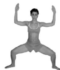
Contrapostura energética del tigre: postura del JINETE