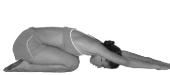
Contrapostura esquelética del tigre: postura del NIÑO